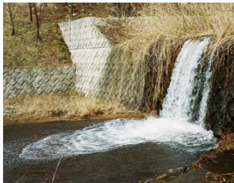
砂防ダム改修前（2008年）